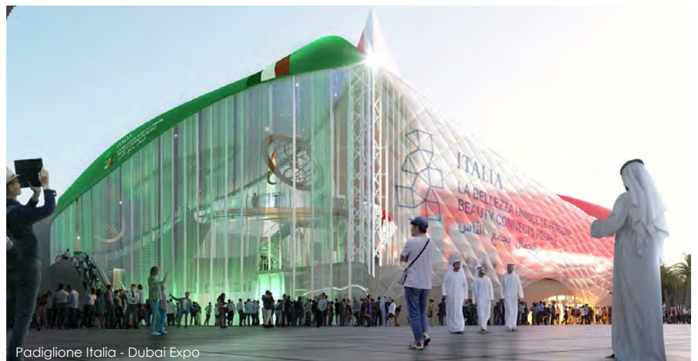
Padiglione Italia - Dubai Expo

Tra i grandi eventi che i paesi del Golfo si preparano ad ospitare spicca l'Expo 2020 Dubai. Per la prima volta la regione ospiterà l'esposizione mondiale nella città di Dubai con il tema "Connecting minds, creating the future". A causa della pandemia l'Expo è stato rinviato di un anno e si svolgerà dal 1 ottobre 2021 al 31 marzo 2022. L'evento porterà molti vantaggi per gli Emirati